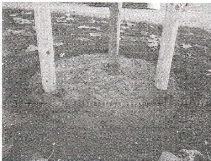
Ryc. 1 - Przykładowa misa do podlewania drzew.